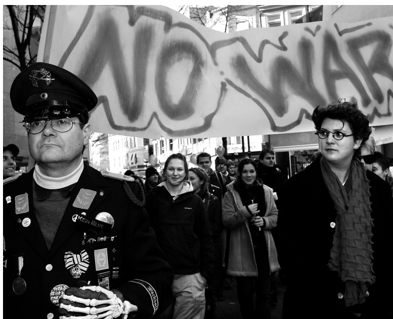
Friedensdemo in Köln am 25. Januar 2003

Den Gedanken greift Broder auf: „Die Kultur des Todes ist so irre, dass wir sie nicht erklären können.“