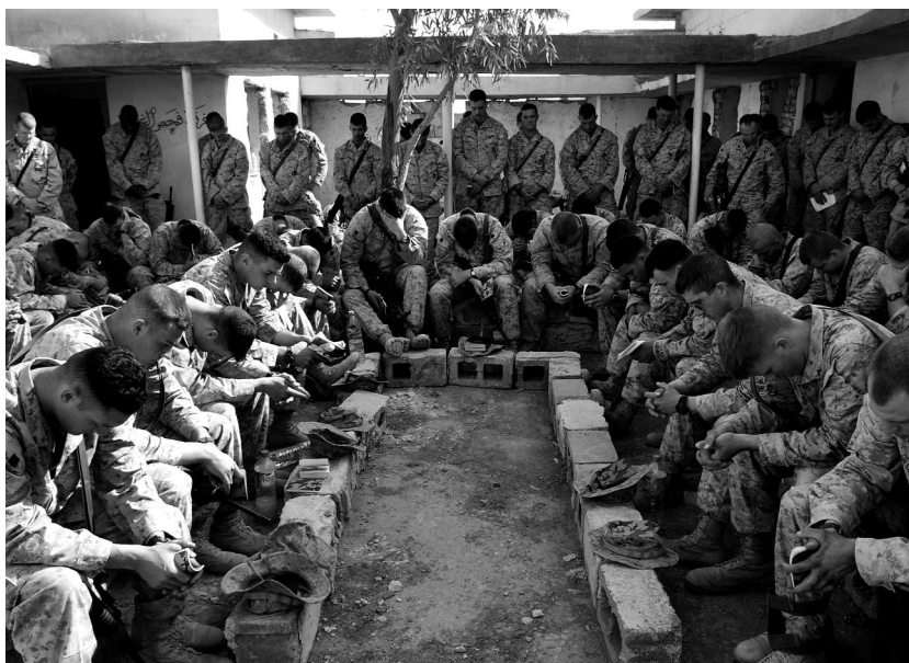
US-Marines der 1st Expeditionary Force bei einem Gottesdienst vor der endgültigen Schlacht um Falludscha, am 7. November 2004